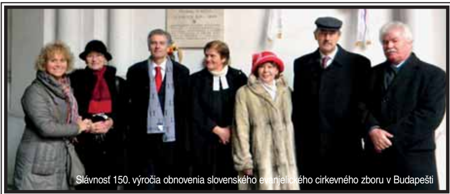
Slávnosť 150. výročia obnovenia slovenského evanjelického cirkevného zboru v Budapešti