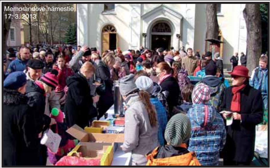
Memorandové námestie, 17. 3. 2013

Na Evanjelickej spojenej škole v Martine je už tradíciou pomáhať iným prostredníctvom rozličných projektov. Tento raz sa sa škola rozhodla finančnou zbierkou podporiť sociálny projekt zameraný na podporu vzdelávania mladých ľudí v Afganistane. Prostredníctvom výstavby Inštitútu odborného vzdelávania v meste Charikar, v provincii Parwan budú môcť chlapi získať vyššie odborné vzdelanie v oblasti poľnohospodárstva a dievčatá v oblasti manažmentu a žurnalistiky.