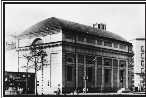
Evanjelický kostol v Budapešti, pôsobisko Jána Kollára

Ludové noviny, ktoré vydávajú maďarskí Slováci, kol-