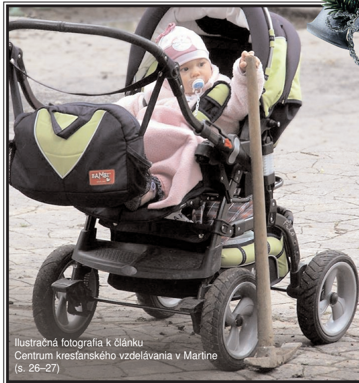
Ilustračná fotografia k článku Centrum kresťanského vzdelávania v Martine (s. 26-27)