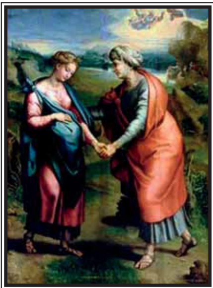
ALŽBETA, POČAS NÁVŠTEVY MÁRIE (L 1, 39–45)

Nasledovala tým pramatku, neplodnú Ráchel, pri narodení Jozefovom (1M 30, 23) i zbožnú Annu pri vyprosenom Samuelovi. (1S 1, 11) Takou zbožnosťou preplnené staré srdce potrebovalo tichosť, skrytosť, pokoj, zatajenie pred ľuďmi, otvorenie srdca pred Bohom za päť mesiacov.