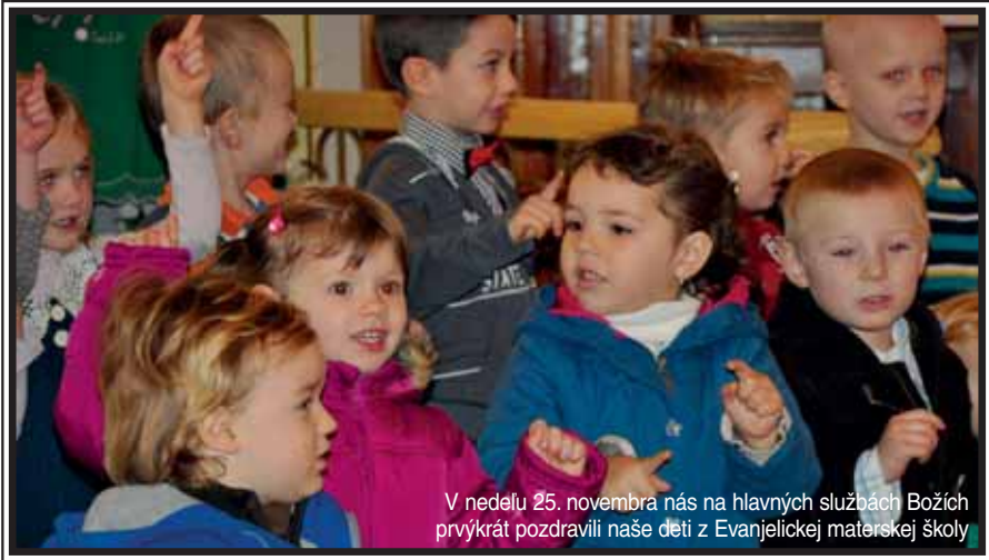
V nedeľu 25. novembra nás na hlavných službách Božích prvýkrát pozdravili naše deti z Evanjelickej materskej školy