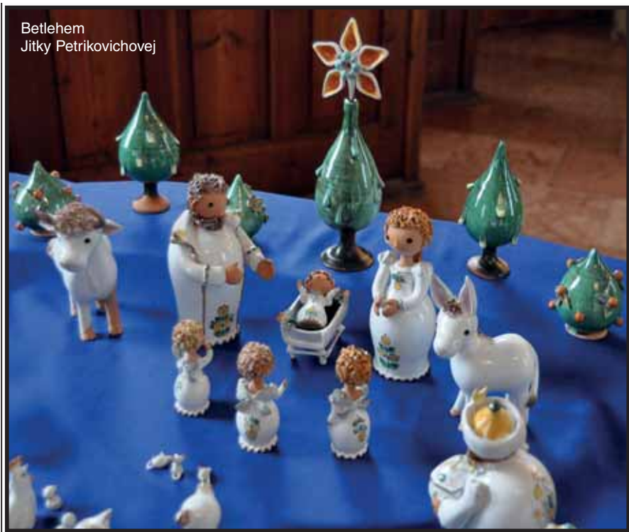
Betlehem Jitky Petrikovichevej

Evanjelický a. v. cirkevný zbor, Evanjelická materská škola, Evanjelická základná škola a Biblická škola v Martine vospolok želajú svojim členom, učiteľom, žiakom, študentom, ako aj priaznivcom doma i v zahraničí radostné Vianoce 2012 a požehnaný nový rok 2013.