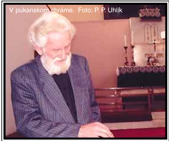
V pukanskom chráme.