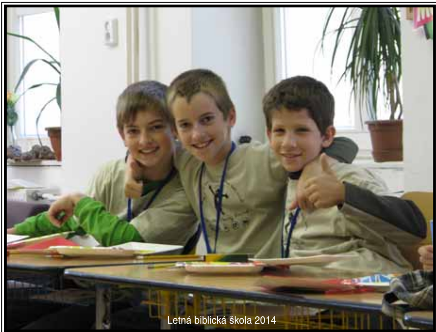
Letná biblická škola 2014