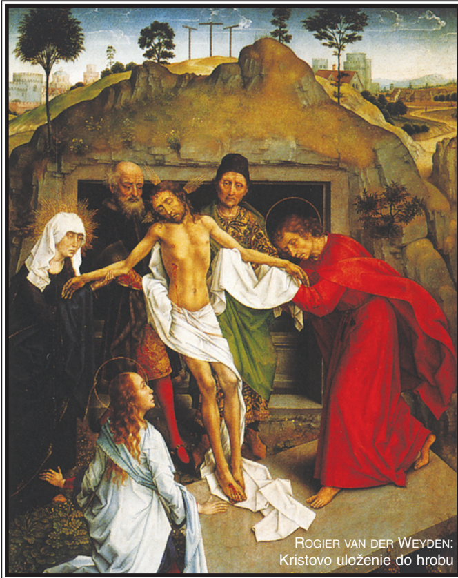
ROGIER VAN DER WEYDEN: Kristovo uloženie do hrobu

Evanjelický a. v. cirkevný zbor, Biblická škola a Evanjelická základná škola v Martine želajú svojim členom a priaznivcom požehnané veľkonočné sviatky pozdravom