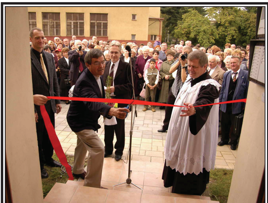
Posviacka obnovenej budovy ev. gymnázia – 25. 9. 2005

Brány naše vypálené v dlhom ťažkom boji, no šík smelých neumdlene na baštách už stojí, zve do práce v ducha zhode, vedie k láske a slobode, hoc hriech úklad strojí.