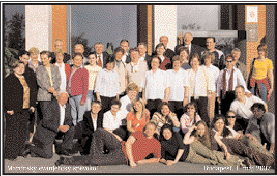
Martinský evanjelický spevokol